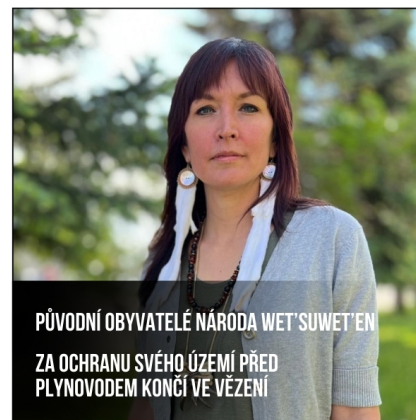
PŮVODNÍ OBYVATELÉ NÁRODA WET'SUWET'EN ZA OCHRANU SVĚHO ÚZEMÍ PŘED PLYNOVODEM KONČÍ VE VĚZENÍ