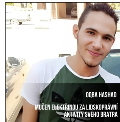
OQBA HASHAD MUČEN ELEKTRÍNOU ZA LIDSKOPRÁVNÍ AKTIVITY SVĚHO BRATRA