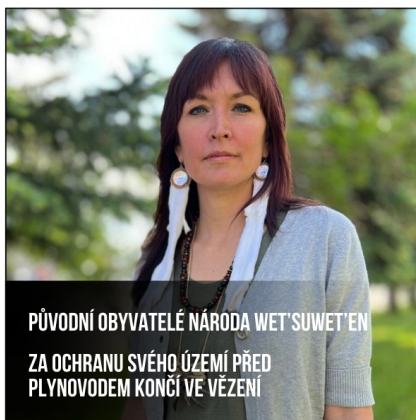
PŮVODNÍ OBYVATELÉ NÁRODA WET'SUWET'EN ZA OCHRANU SVĚHO ÚZEMÍ PŘED PLYNOVODEM KONČÍ VE VĚZENÍ