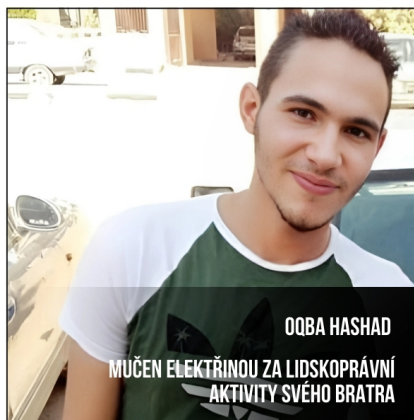
OQBA HASHAD MUČEN ELEKTRÍNOU ZA LIDSKOPRÁVNÍ AKTIVITY SVĚHO BRATRA